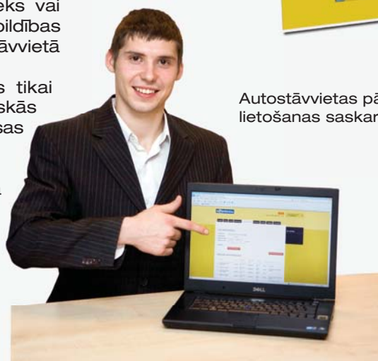
Autostāvvietas pārvaldnieka lietošanas saskarne